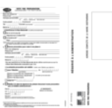
• CERFA 14952 Demande de vote par procuration