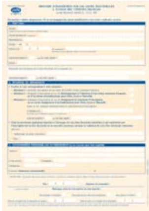
• CERFA 12669 Demande d'inscription sur les listes électorales

04 90 65 86 90 – administration@gigondas-mairie.fr